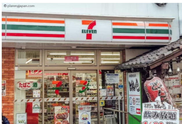
Bentobox aus dem Konbini