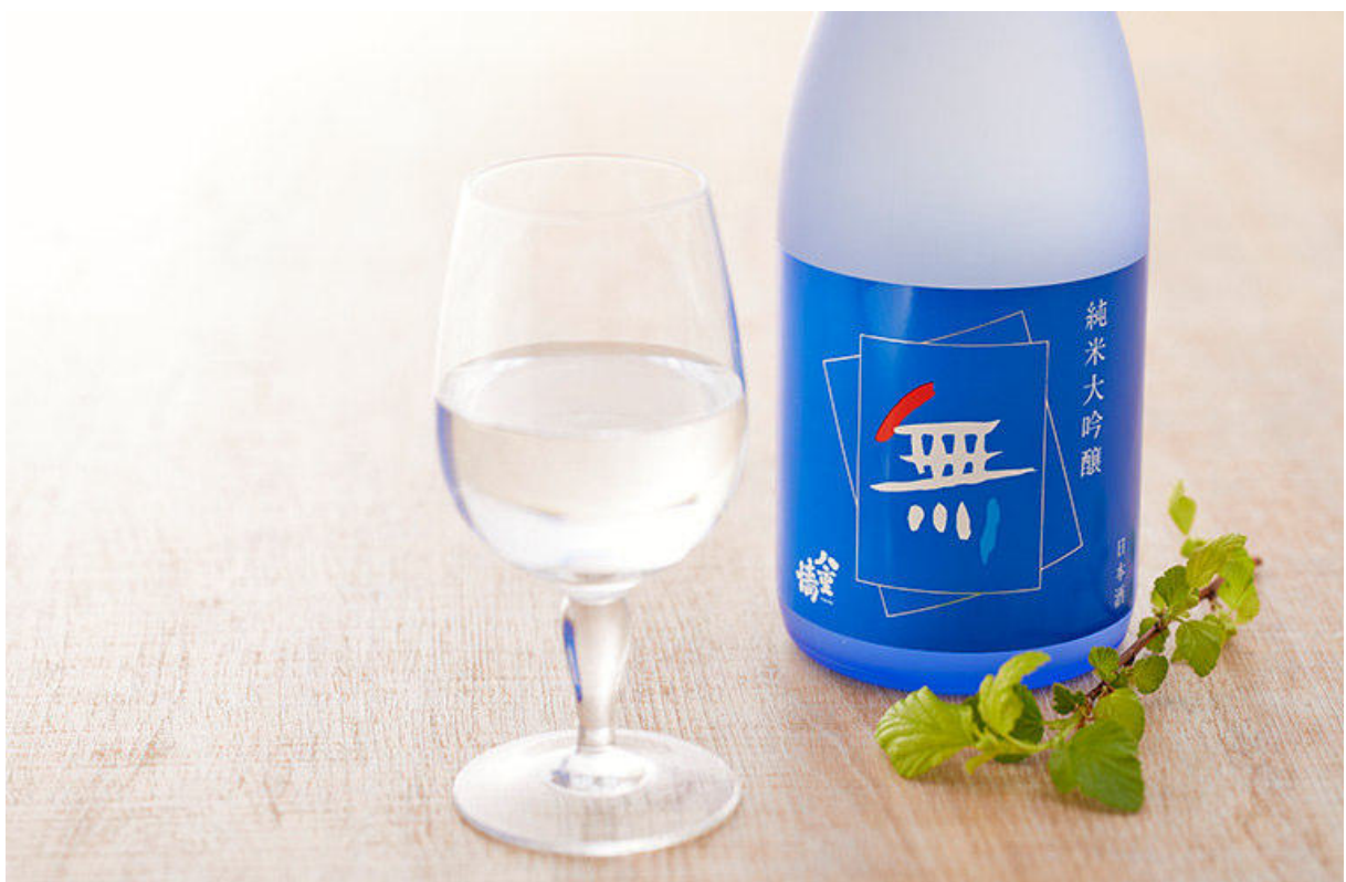
Junmai Daiginjo „Aonomu“ von Yaegaki 2.970 Yen (720 ml)

In der Souvenirhalle „Piolo Omiyage-kan“ auf der Südseite des zentralen Ticketschalters des JR-Bahnhofs Himeji können Sie berühmte Spezialitäten aus Himeji wie „Eki-Soba“ und „Himeji Oden“ probieren. Außerdem können Sie dort Souvenirs mit Spezialitäten aus Himeji kaufen. Wir empfehlen Ihnen „Monaka“, ein Monaka in Form der Burg Himeji. Das Set enthält ein Monaka in Form der Burg Himeji und ein Dorayaki (Dorayaki-Kuchen), das den Steinmauern der Burg Himeji nachempfunden ist und sich somit perfekt als Souvenir aus Himeji eignet.