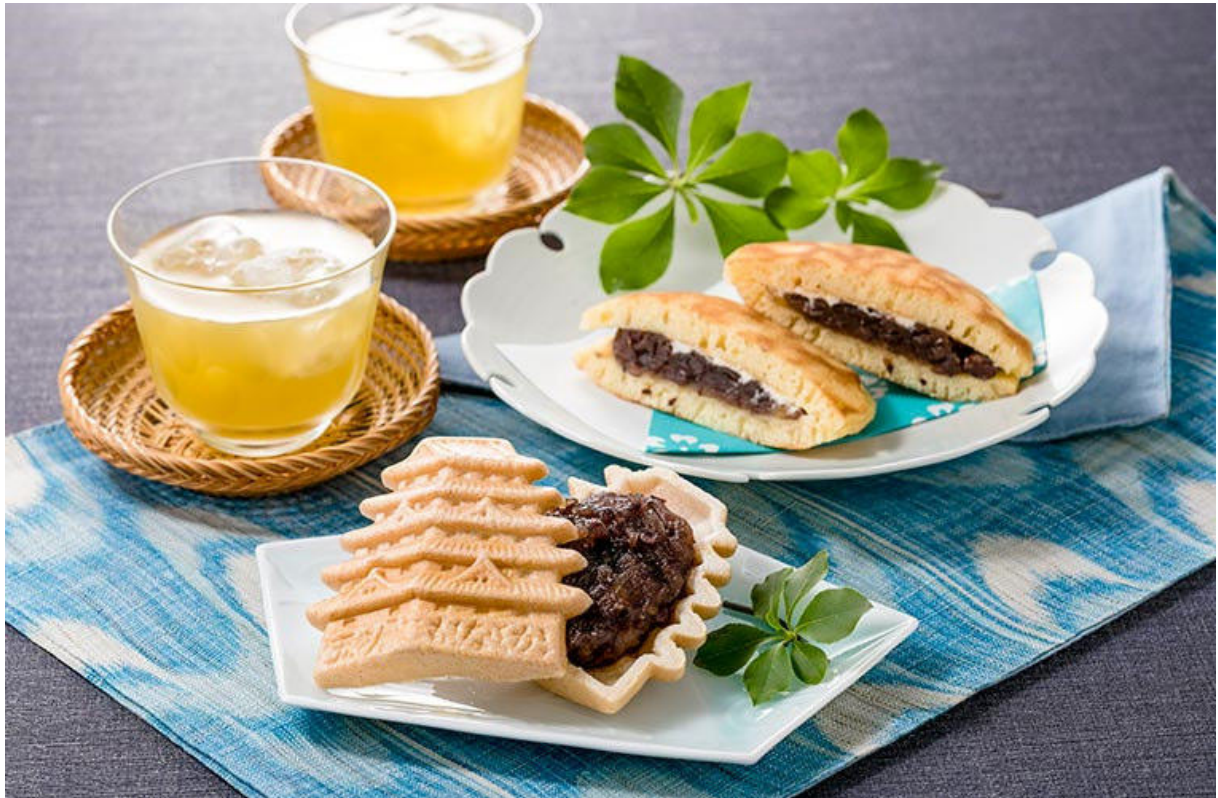
Himeji Romance Sortiment von Goso Monaka Honpo 1.339 Yen (6 Stück)

In der Souvenirhalle „Piolo Omiyage-kan“ auf der Südseite des zentralen Ticketschalters des JR-Bahnhofs Himeji können Sie berühmte Spezialitäten aus Himeji wie „Eki-Soba“ und „Himeji Oden“ probieren. Außerdem können Sie dort Souvenirs mit Spezialitäten aus Himeji kaufen. Wir empfehlen Ihnen „Monaka“, ein Monaka in Form der Burg Himeji. Das Set enthält ein Monaka in Form der Burg Himeji und ein Dorayaki (Dorayaki-Kuchen), das den Steinmauern der Burg Himeji nachempfunden ist und sich somit perfekt als Souvenir aus Himeji eignet.