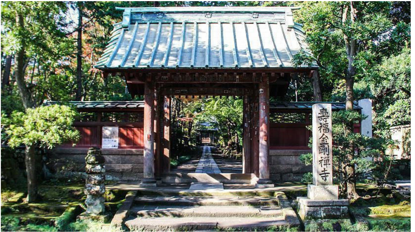
Der Jōchi-ji besticht durch seine ruhige Atmosphäre und schönen Gärten.